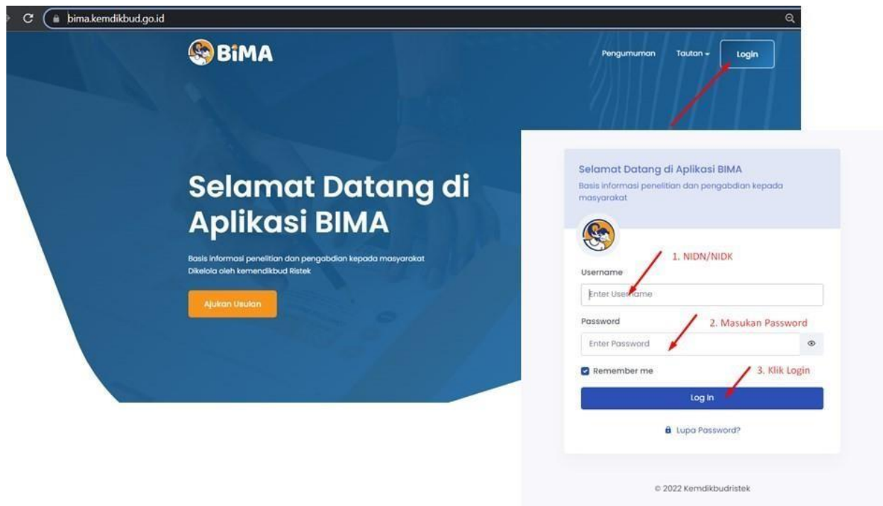
Gambar 1. Beranda akses memasuki aplikasi BIMA

Penerima pendanaan Program Penelitian Batch II, Program KATALIS, Program Pengabdian kepada Masyarakat Tahap II dan Program Bantuan Biaya Luaran Prototipe di Perguruan Tinggi Penyelenggara Pendidikan Akademik Tahun Anggaran 2024 wajib melakukan revisi proposal, rencana anggaran biaya (RAB), dan mengunggah surat pernyataan kesanggupan pelaksanaan melalui aplikasi BIMA pada laman http://bima.kemdikbud.go.id/ dengan menggunakan akun ketua pengusul masing-masing, sebagaimana diperlihatkan pada Gambar 1.